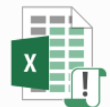
Lignes Directrices de Gestion.xlsxm

Il pourra vous adresser un fichier Excel comprenant une feuille « LDG » qui sera déjà alimentée par les données du Bilan Social 2019 de votre collectivité.