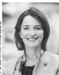
A.-C. COMPAN / HANS LUCAS

Dans le cas des solutions mutualisées, les économies sont évidentes: «Pour les marchés publics, nous