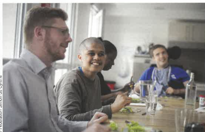
Créées par la Fédération Simon de Cyrène, les maisons partagées accueillent des personnes handicapées et valides (volontaires en service civique et travailleurs sociaux salariés de l'organisation). Lire Direction[s] n° 156, p. 22.

Il convient bien sûr de s'assurer que l'ambition répond bien à un besoin pour ne pas se retrouver avec des locaux sans vie, voire vides, sur les bras. Puis d'affiner les contours du projet, en déplaçant certains curseurs : appartement « en diffus » ou colocation, organisation d'une simple veille sociale ou mise en place d'un soutien renforcé à la convivialité (lire le tableau). Ainsi, l'Union nationale ADMR, qui déploie sur le territoire les résidences Habiter autrement, épaulé les associations du réseau dans la concrétisation de leur idée : « Nous mettons en place un comité de pilotage avec les partenaires, puis nous réalisons une étude d'opportunité, recueillons les attentes, établissons un budget prévision-